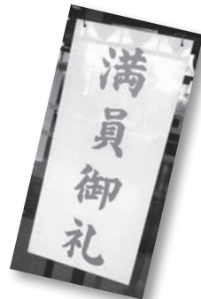
コロナでなかなか客足が戻らない舞台。いつかまた「連日満員御礼」となりませうように！

の悪化があります。医療崩壊すらも言われている中で、芸術のような生命身体にかかわらない「ぜいたく品」は二の次、三の次だ……そうしたご意見も当然かと思えます。 ただ、私は「ふつうの人」として、芸術という火に小さな薪をくべ続けたいと思っています。この投稿も、そんな薪のひとつとなればと思います。