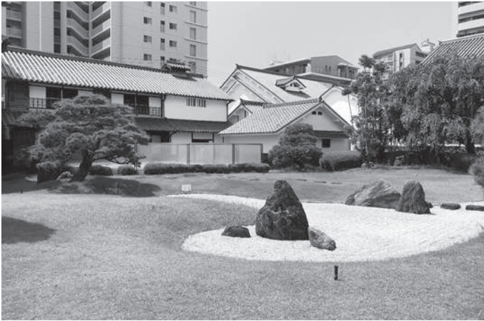
伊丹市美術館に行ったときの写真です。展示も建物もお庭も、とても素敵な美術館でした。

の悪化があります。医療崩壊すらも言われている中で、芸術のような生命身体にかかわらない「ぜいたく品」は二の次、三の次だ……そうしたご意見も当然かと思えます。 ただ、私は「ふつうの人」として、芸術という火に小さな薪をくべ続けたいと思っています。この投稿も、そんな薪のひとつとなればと思います。