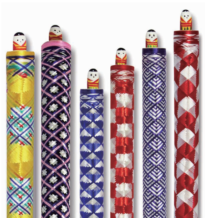
基本模様はうろこ・市松・青海波・矢がすりの4種類

有馬の人形筆の起源は、室町時代であるといわれています。文字を書こうと筆を持つと、筆の尻から可愛い人形が飛び出すからくり細工と、絹糸を巻いて美しい模様を筆の柄につけるのが特徴です。柄の模様は、色鮮やかな「市松」「青海波」「うろこ」「矢がすり」の4種類を基本とし、組み合わせや色を変え無限の模様を手作業で生み出しています。大正時代には4～5軒あった人形筆作りの店も今では1軒だけであり、筆は全行程手作業で作られるために一日に12～13本しか作れません。一本一本心を込めて作られるこの筆は、書道用だけでなく、絵筆にも使えます。