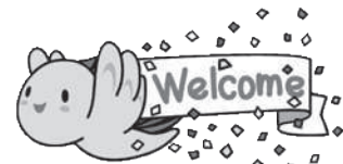
兵庫県マスコット「はばタン」

首都圏にお住まいの兵庫を故郷とする皆さん!! 兵庫にゆかりのある皆さん!! 東京兵庫県人会でネットワークを広げませんか?