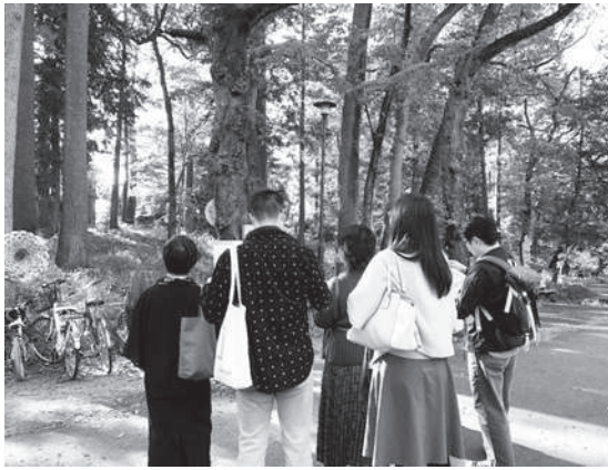
会社の同僚たちを誘って、地域の小さな芸術祭鑑賞ツアーを企画。

それと前後して、東京で開催された学会に行ったとき、東京で働く友人の家に泊めてもらう約束をしていました。彼女との待ち合わせまでの時間つぶしに、上野の美術館にふらっと寄ったこ