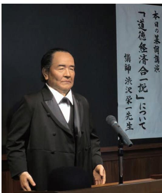
記念館では、栄一のアンドロイドによる講演も

栄一は天保11(1840)年、現在の深谷市血洗島(ちあらいじま)に生まれた。渋沢栄一記念館、旧渋沢邸「中の家(なかんち)」などによると、渋沢家は開拓者で、父の市郎右衛門は中の家に婿入り。学問をたしなみ、勤勉で養蚕のほか藍玉を作って販売し、一時は傾いていた同家を立て直した。雑貨や質屋も手掛けかなり裕福な家庭だったという。