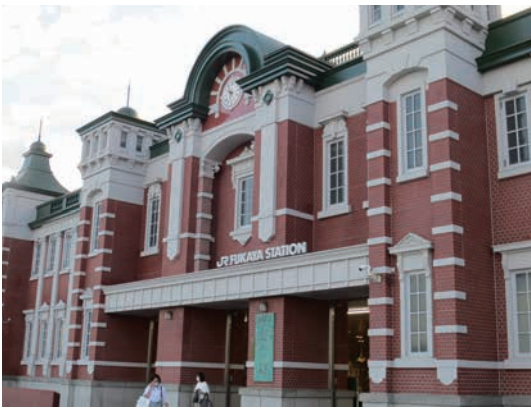
レンガ造りの外観が美しいJR深谷駅

誠之堂は初代頭取だった栄一の喜寿を記念し、第一銀行行員たちが建設した。あえて色むらを付けたレンガや、祝宴を描いたステンドグラスが目を引く。世界で活躍した栄一をたたえ、西洋建築を中心に中国、朝鮮半島、日本の要素を取り入れた。清風亭はスパニッシュ瓦の屋根やペランダのアーチ、円柱の装飾など当時流行していた南欧田園趣味の建物。こちらは、栄一の後継、佐々木勇之助頭取の古希を記念して贈られた。 栄一は都市の近代化に欠かせないとして、深谷市に日本初の機械式レンガ工場を設立し、今もホフマン輪窯6号窯などが歴史遺産として残る。このため、同市はレンガを生か