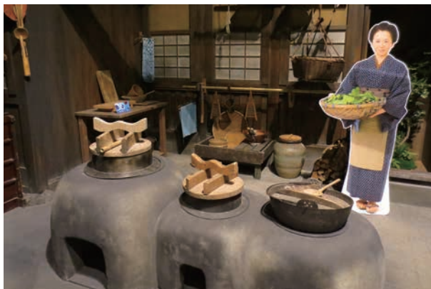
栄一の家を創作したセットがある深谷大河ドラマ館