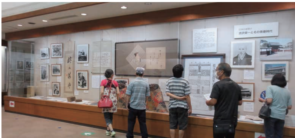
住民が持ち寄った資料などを展示する渋沢栄一記念館

最初に訪ねたのは渋沢栄一にまつわる資料を集めた「渋沢栄一記念館」(深谷市下手計)。同館には約150