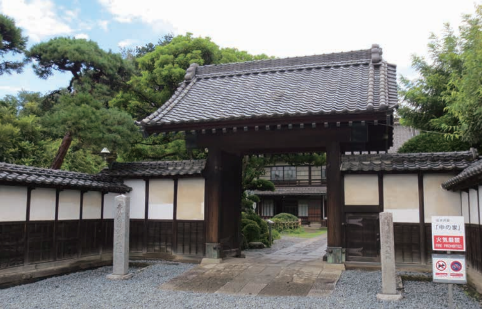
中の家の立派な門構え。扉はケヤキの一枚板で作られた。

建てで、西側には平屋部分がある。この主屋を囲むように副屋と土蔵、正門、東門が建つ。ていは、明るく朗らかで、栄一に代わり夫とよく家を守った。栄一は、忙しい中でもよく中の家を訪ねた。帰郷の際の部屋は奥の十畳と決まっていたという。夫妻が栄一のために特別念入りに作らせたそうので、