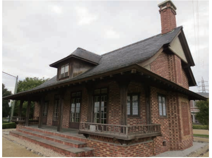
色むらのあるレンガが個性的な誠之堂