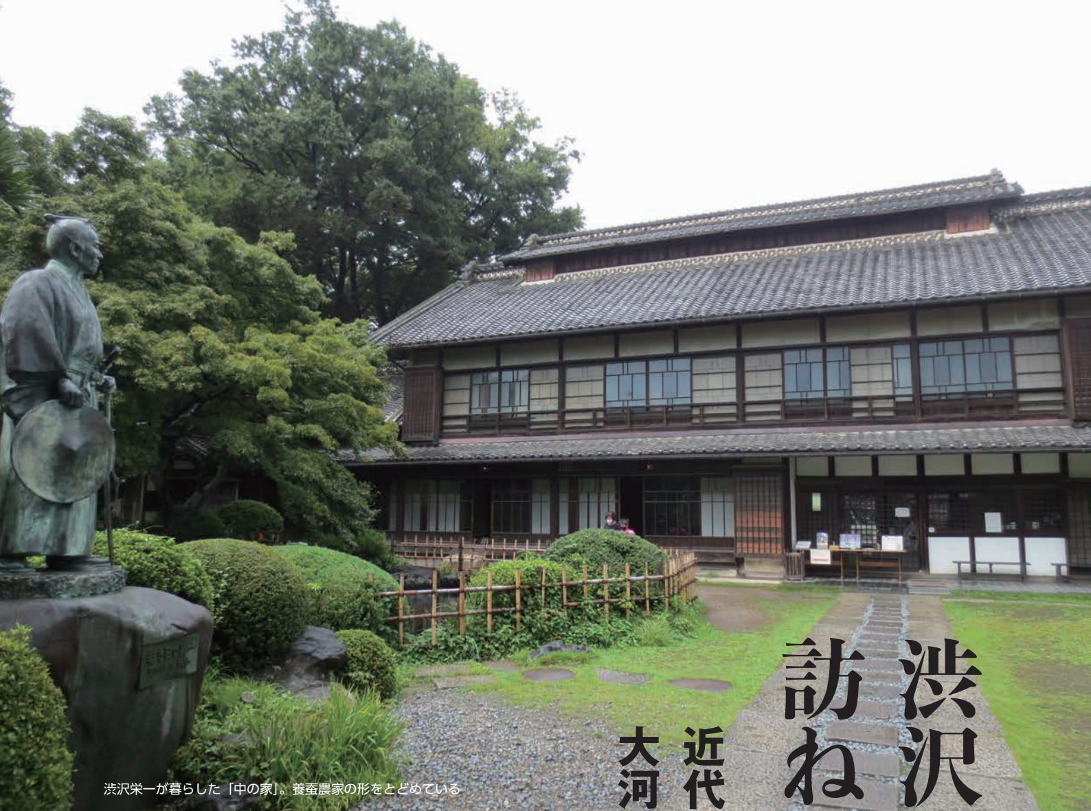
渋沢栄一が暮らした「中の家」。養蚕農家の形をとどめている