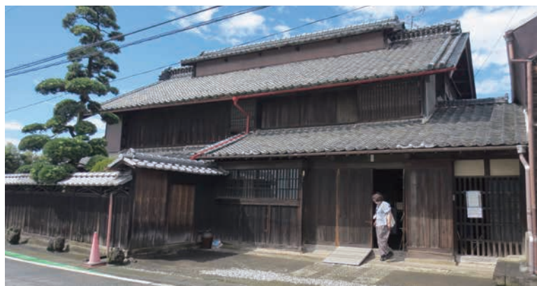
栄一に影響を与えた尾高惇忠の生家

中の家からそう遠くない下手計に、尾高惇忠（じゅんちゆう）の生家を訪ねる。ここで栄一と関係の深い惇忠（後に藍香と号した）、栄一