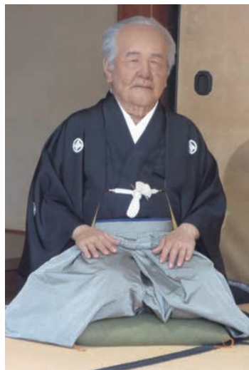
80歳頃の姿をイメージした渋沢栄一のアンドロイド

建てで、西側には平屋部分がある。この主屋を囲むように副屋と土蔵、正門、東門が建つ。ていは、明るく朗らかで、栄一に代わり夫とよく家を守った。栄一は、忙しい中でもよく中の家を訪ねた。帰郷の際の部屋は奥の十畳と決まっていたという。夫妻が栄一のために特別念入りに作らせたそうので、