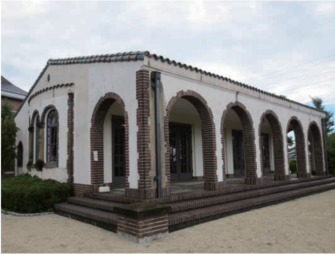
スパニッシュ瓦が用いられた清風亭